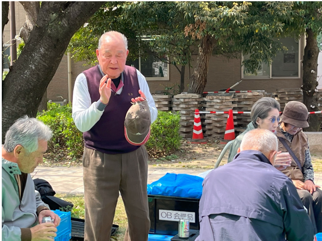
今回も大先輩にお会いできました