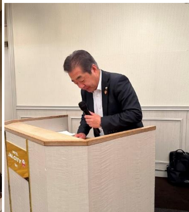
<司会の三浦副支部長>