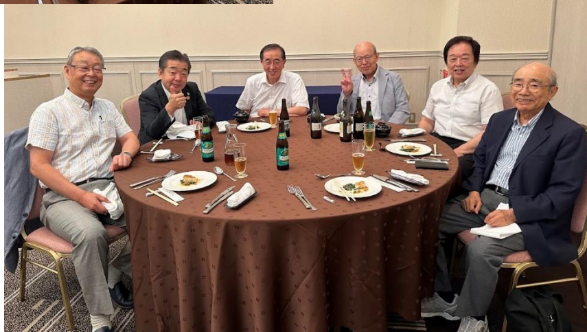
＜支部功労賞受賞者 3 名による中締め挨拶＞