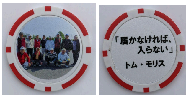
(記念のボールマークの裏表)

天気予報では午後から雨でしたが、運よく全員がホールアウトしてから雨が降り出し、傘、カップ等無しでプレーができました。