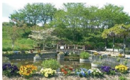
▲箕島ふれあいの里