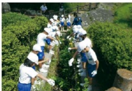
▲小学生とホタルの幼虫を放流している様子