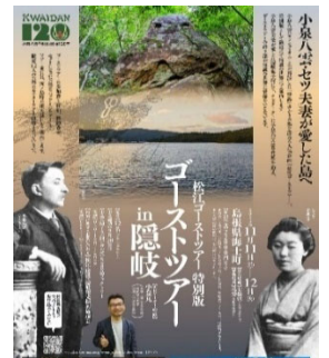
松江ゴーストツアー