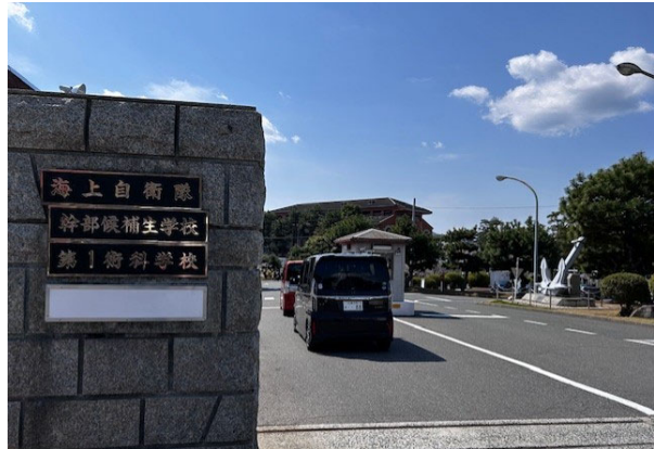
（海上自衛隊幹部候補生学校 正門）