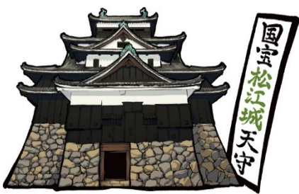
松江城（ガイド案内）

朝ドラ【ばけばけ】は、明治時代の松江を舞台に、小泉八雲と妻セツがモデルになっています。小泉八雲が愛した怪談のふるさと松江で、地元の語り部が、心を込めて怪談の世界に誘う松江ならではの「松江ゴーストツアー」を始め、国宝10周年を迎えた「松江城」、松江名物三種盛「こども落語」、「松江水燈路」等々【楽しくて、愉快に、ちょっぴり怖い】ツアーを企画致しました。