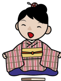
子ども落語（松江名物三種盛）