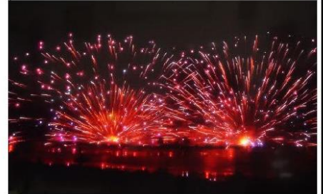
諏訪湖花火

さわやか信州にも 暑い夏がやってきました。 熱中症に気を付けて すごしましょう!