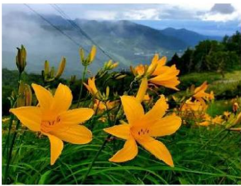
志賀高原・ニッコウキスゲ