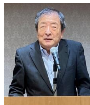
大田関西支部長挨拶