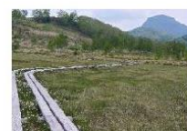
田ノ原湿原と笠岳