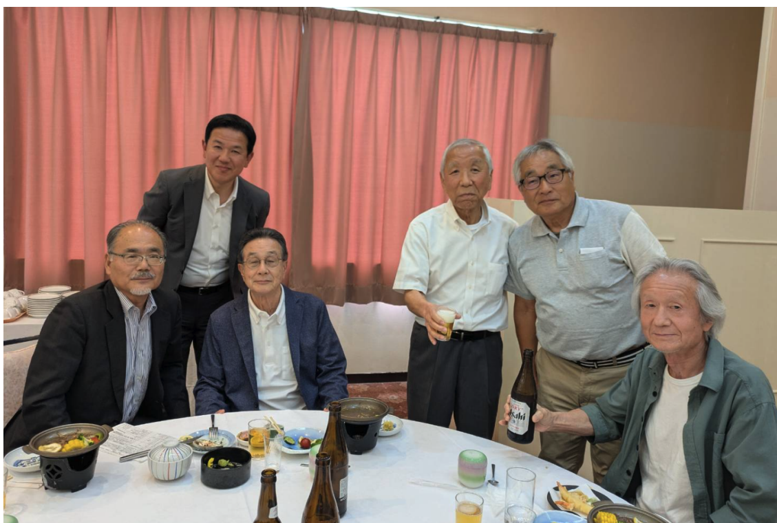
はいビール！誰が誰だか分かるかな？

お食事に舌鼓を打ちながら皆さまからの1分間スピーチと、6つのテーブルにマイクは回りお酒も回り、まるで回転すし状況。楽しくもあわただしい時間はあっという間でした。また退職後にご無沙汰だったメンバーと現役の女性5名が初参加してくれ、このことも大いに盛り上がったことでした。