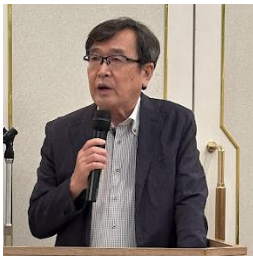
＜会則改定の説明をする千葉副支部長＞