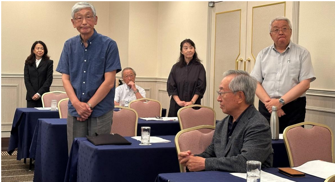
＜役員改選で新たに役員に就任した4名の皆様