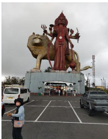
《ヒンドゥー教の聖地「グランバッサン」のヴィシュヌ》