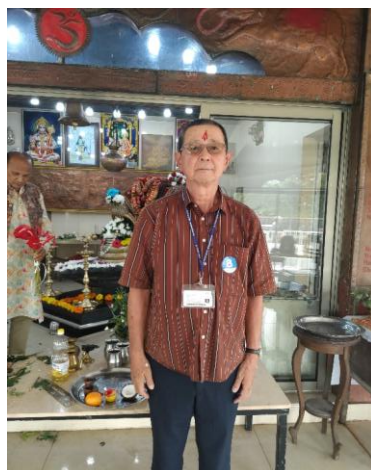
《珍しいビンディをした男》