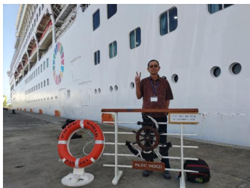
《ようこそピースポート》